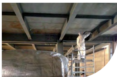
AÉROPORT - BARI - ITALIE