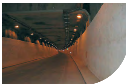
"CIRCONVALLAZIONE NORD" REVÊTEMENT DE LA GALERIE - ROME - ITALIE