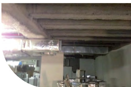
ENPAM - ROME - ITALIE