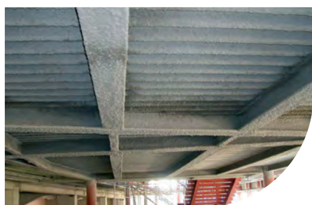
CINEMA MULTIPLEX - TORINO - ITALIE