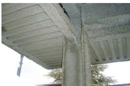
HÔPITAL - GRAVEDONA (CO) - ITALIE