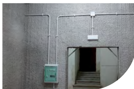
LA POSTE - CATANIA - ITALIE